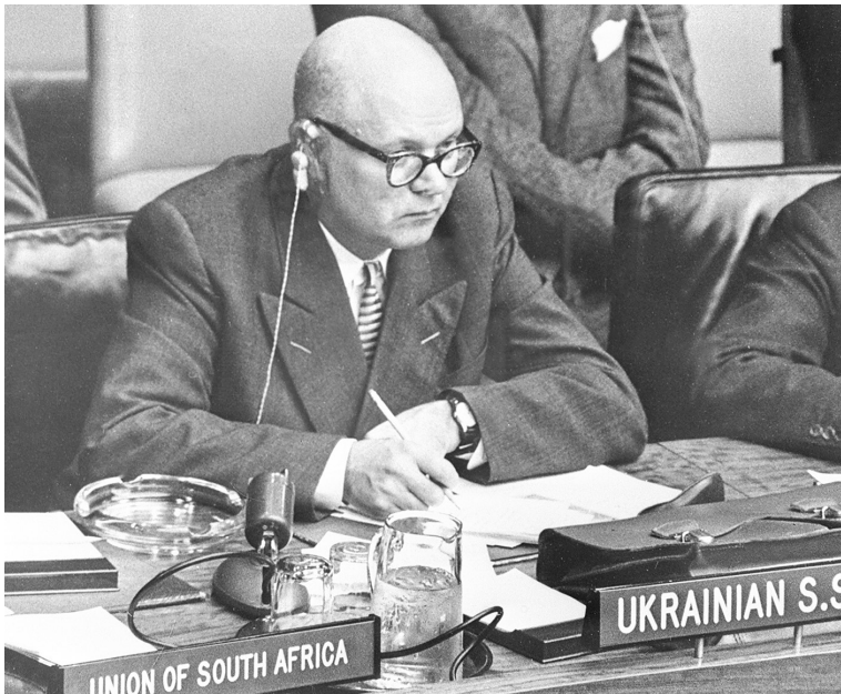
Постійний представник УРСР у Комісії ООН з прав людини П.О. Недбайло на 14-й сесії Генеральної Асамблеї ООН. Нью-Йорк (США), 21 жовтня 1959 року ЦДКФФА України ім. Г.С. Пшеничного, од. обл. 2-82579