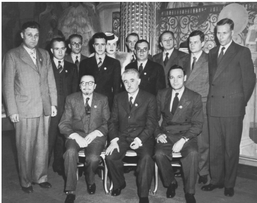
Делегація УРСР на Установчій конференції ООН. Сидять: О.В. Палладін, Д.З. Мануїльський, І.С. Сенін. Сан-Франциско (США), 1945 р.

American cadets raise the flag of the Ukrainian SSR in the courtyard of San Francisco City Hall, where the United Nations Conference was being held. 1945.