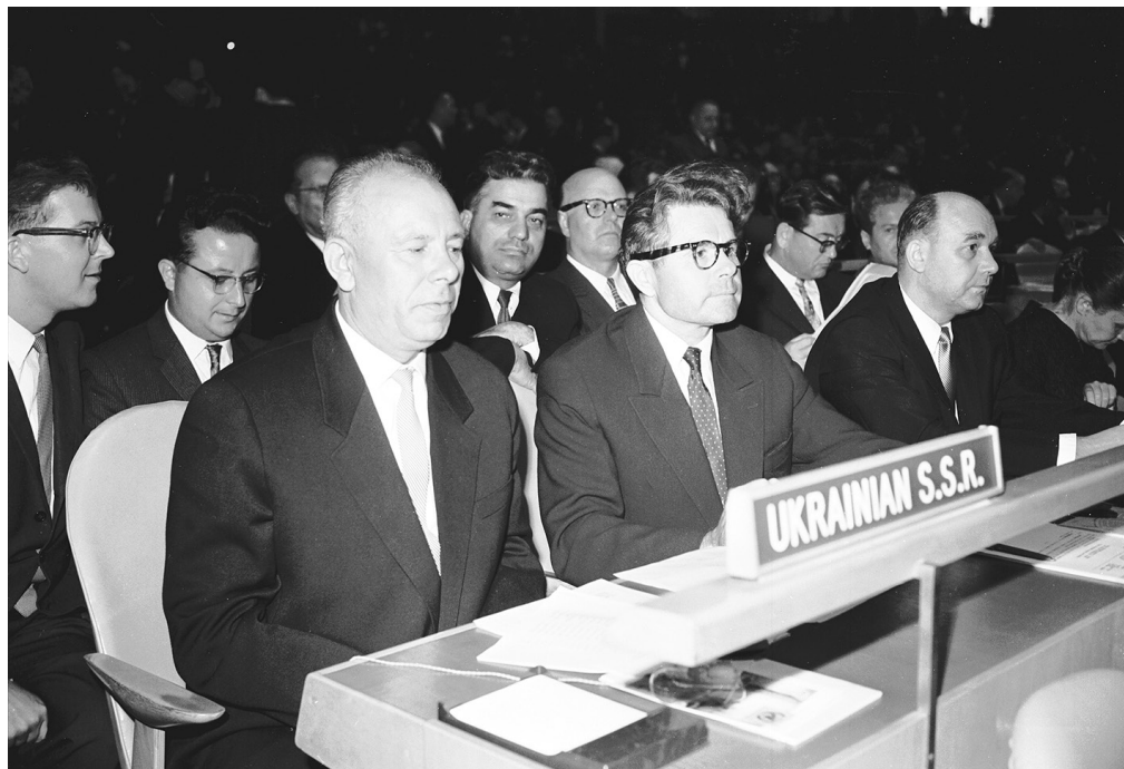
Делегація УРСР у залі засідань 15-ї сесії Генеральної Асамблеї ООН. Зліва направо: М.В. Підгорний, Л.Ф. Паламарчук, П.П. Удовиченко. Нью-Йорк (США), 1960 р.

ЦДКФФА України ім. Г.С. Пшеничного, од. обл. 2-83376