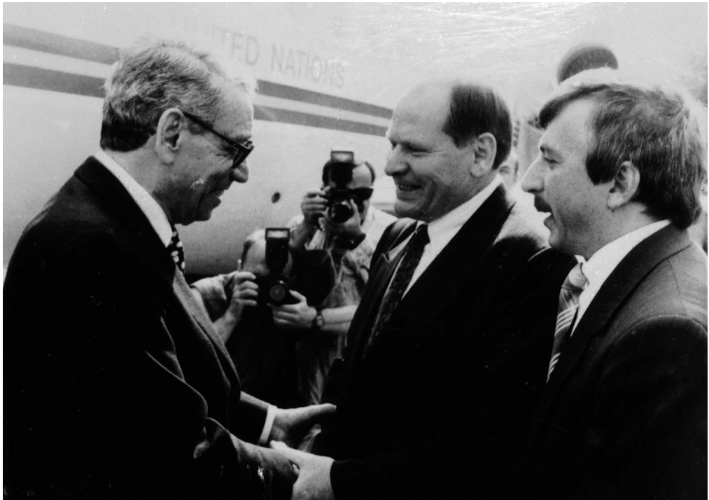
Зустріч Генерального секретаря ООН Бутроса Бутроса-Галі в Бориспільському аеропорту. Другий справа – віцепрем'єр-міністр України з питань гуманітарної політики М.Г. Жулинський. Київщина., 17 червня 1993 року

ЦДКФФА України ім. Г.С. Пшеничного, од. обл. 0-197035