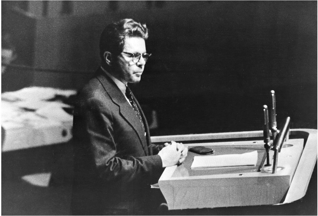
Міністр закордонних справ УРСР Л.Х. Паламарчук під час виступу на 11-й сесії Генеральної Асамблеї ООН. Нью-Йорк (США), 17 листопада 1956 року ЦДКФФА України ім. Г.С. Пшеничного, од. обл. 2-85461