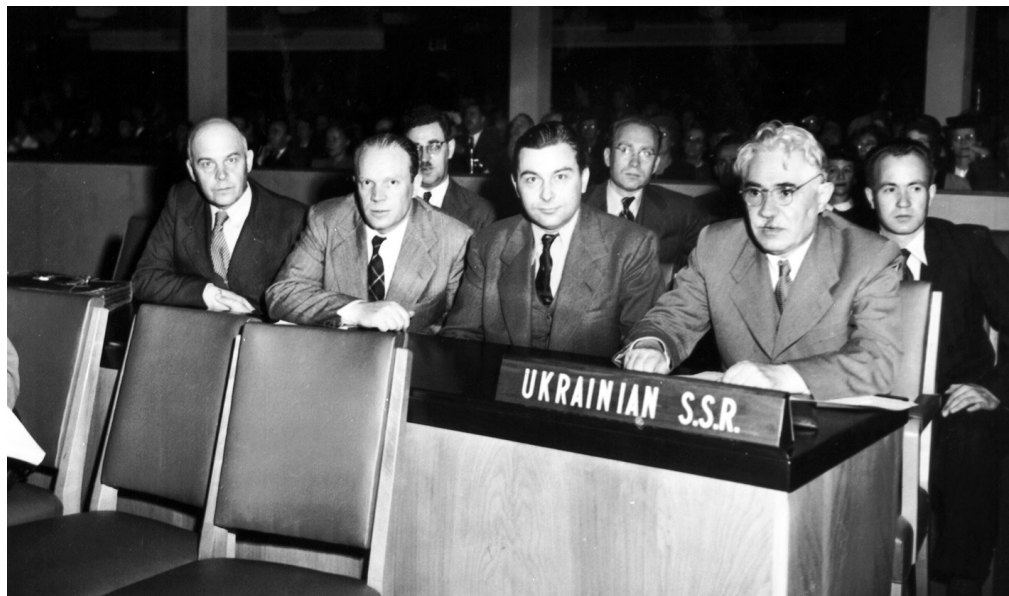
Делегація УРСР на першій сесії Генеральної Асамблеї ООН. 1-й справа – Міністр закордонних справ УРСР Д.З. Мануїльський, 4-й – заслужений діяч науки УРСР, професор Ф.Я. Примак. Нью-Йорк (США), 1946 р. ЦДКДФА України ім. Г.С. Пшеничного, од. обл. 0-56942