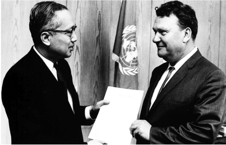
Постійний представник УРСР в ООН С.Т. Шевченко (праворуч) вручає Вірчі грамоти Генеральному секретареві ООН У Тану, Нью-Йорк (США), 8 вересня 1964 року ЦДКФФА України ім. Г.С. Пшеничного, од. обл. 0-171871