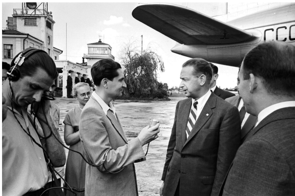
Генеральний секретар ООН Даг Гаммаршельд дає інтерв'ю в аеропорту під час перебування в Україні. Київ, 6 липня 1956 року ЦДКДФА України ім. Г.С. Пшеничного, од. обл. 0-86653