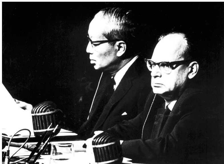
Генеральний секретар ООН У Тан (зліва) з Міністром закордонних справ і головою делегації УРСР в ООН Г.Г. Шевелем у президії. Нью-Йорк (США), 1970 р. ЦДКФФА України ім. Г.С. Пшеничного, од. обл. 0-196965

UN Secretary-General U Thant (left) and Deputy President of the 25 th UN General Assembly, Minister of Foreign Affairs of the Ukrainian SSR Heorhii Shevel (right) preside over the plenary meeting. New York, 1970. TsDKFFA, od. obl. 0-196965