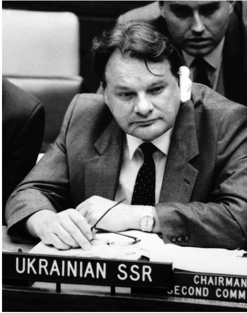
Постійний представник УРСР в ООН Г.Й. Удовенко в залі засідань Другого комітету 42-ї сесії Генеральної Асамблеї ООН. Нью-Йорк (США), 1987 р.

ЦДКФФА України ім. Г.С. Пшеничного, од. обл. 0-197012