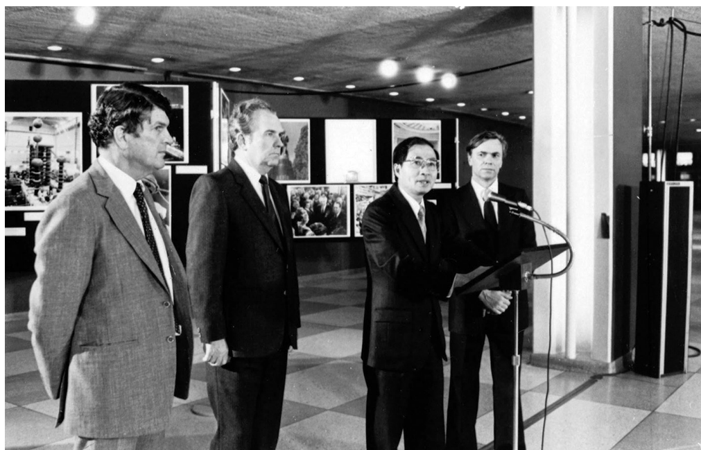
Відкриття виставки, присвяченої 1500-річчю м. Києва, у Штаб-квартирі ООН. Зліва направо: Міністр закордонних справ УРСР В.Н. Мартиненко (2-й), заступник Генерального секретаря ООН Акасі Ясусі, Постійний представник УРСР в ООН В.О. Кравець. Нью-Йорк (США), 22 вересня 1982 року ЦДКФФА України ім. Г.С. Пшеничного, од. обл. 0-171948

UN Secretary-General U Thant (left) and Deputy President of the 25 th UN General Assembly, Minister of Foreign Affairs of the Ukrainian SSR Heorhii Shevel (right) preside over the plenary meeting. New York, 1970. TsDKFFA, od. obl. 0-196965